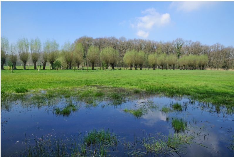
Kopfbäumreihe in Nettetal-Hinsbeck (An der Sonnenbeck)