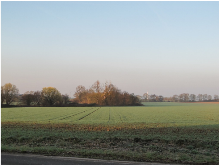
Gehölzbestandene Höckerlinie des Westwalls in Horbach bei Aachen als Biotopverbundstruktur (2017)