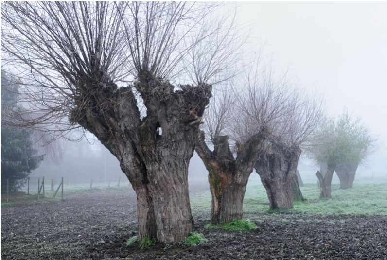
Kopfweidenreihe in Nettetal-Breyell (Am Berg)