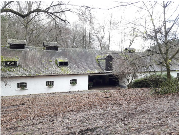
Wirtschaftsgebäude der Nonnenmühle bei Geisenheim (2017)