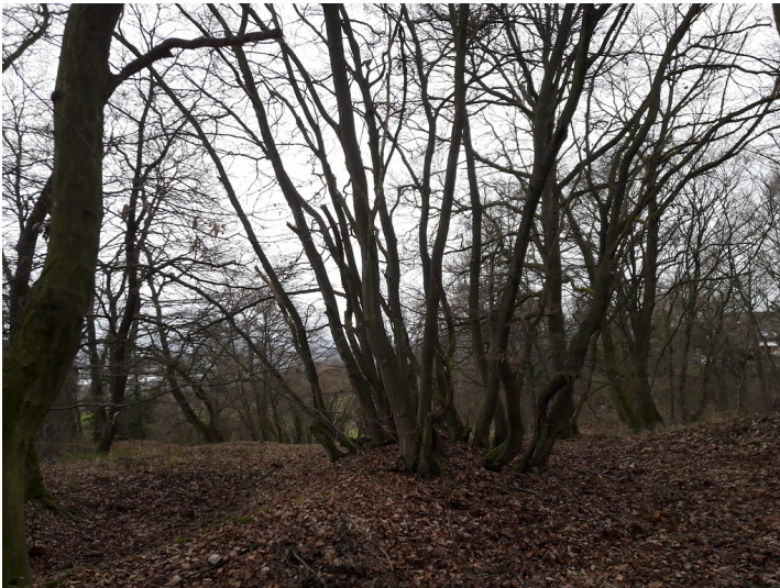
Naturschutzgebiet Geisenheimer Heide bei Geisenheim. Mehrstämmige Buche im Teilgebiet Heidestücker, Zeugnis ehemaliger Niederwaldwirtschaft (2017).