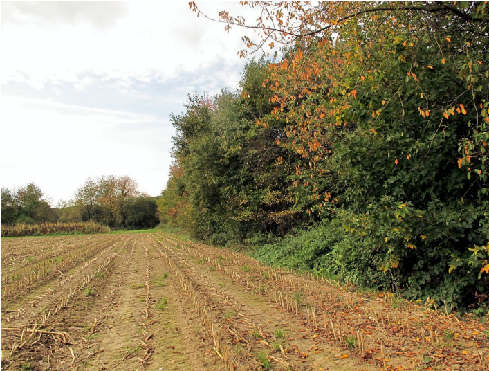
Biotopverbund Westwall am Steppenberger in Aachen (2017)