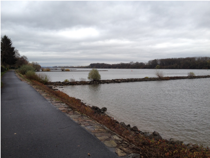
Blick auf die Bühnen vor der Schönborn'schen Aue (2017)