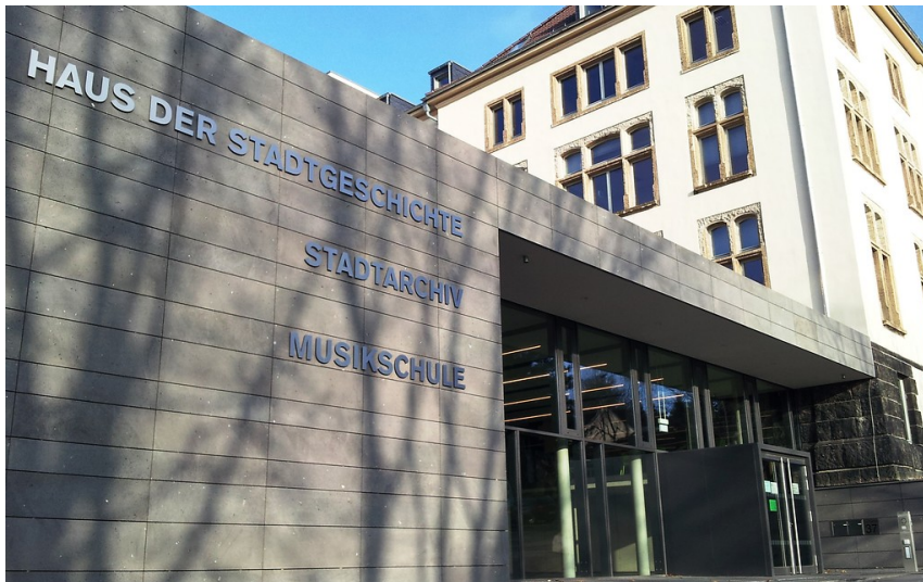
Gebäudeansicht des Stadtarchivs ("Haus der Stadtgeschichte") und der Musikschule in Mülheim an der Ruhr (2013)