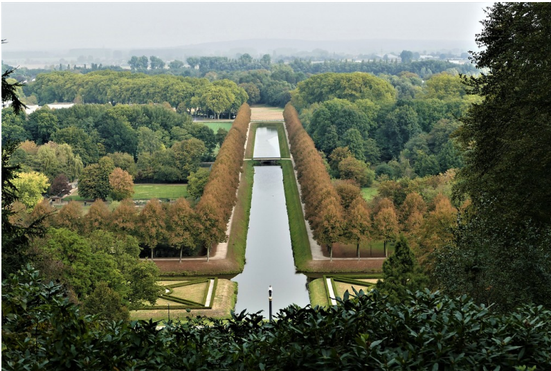
Neuer Tiergarten Kleve (2016)