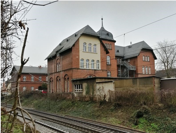
Ehemalige Dienstwohnungen der Forschungsanstalt Geisenheim