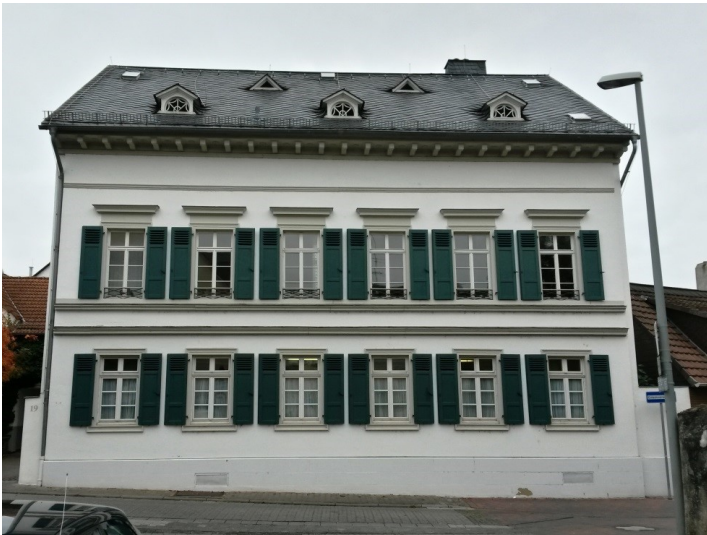
Institutsgebäude Kellerwirtschaft-Weinbau in Geisenheim