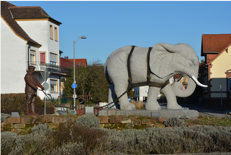
Die Granitskulptur eines Elefanten in einem Geschirr; dahinter befindet sich der Schreinermeister Schmitt aus Enkenbach (2018).