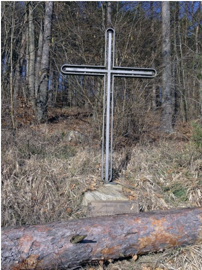
Das Pilgerkreuz am Lampertsbach wenige Tage nach Durchzug des Orkantiefs "Friederike" am 18. Januar 2018