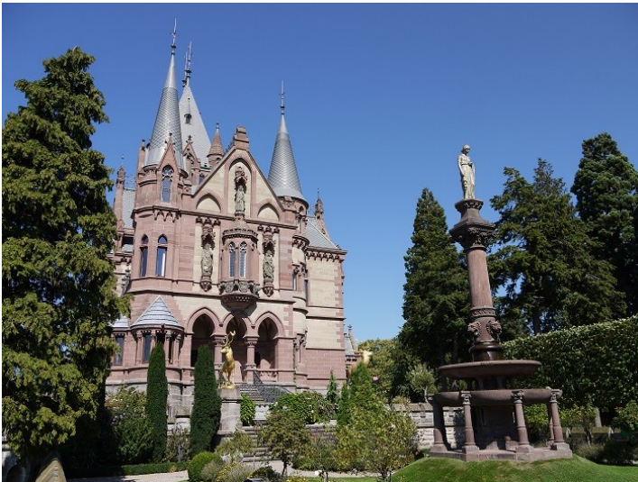
Venusterrasse des Schlosses Drachenburg im Siebengebirge bei Königswinter (2013)