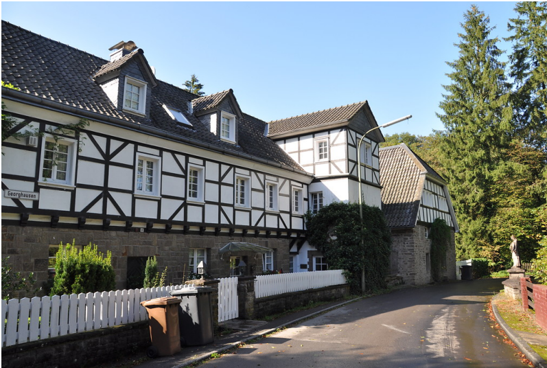
Schlossmühle Georghausen (2014)