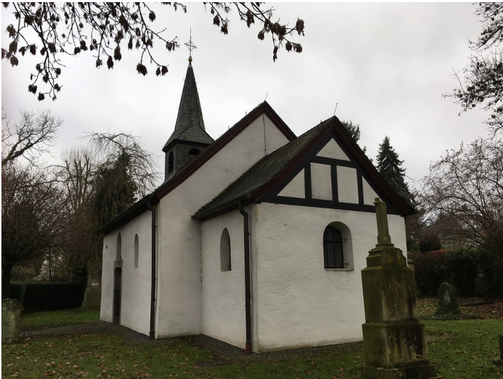
Nikolauskapelle in Westhoven, Blick auf Rechteckchor und Dachgiebel (2017).