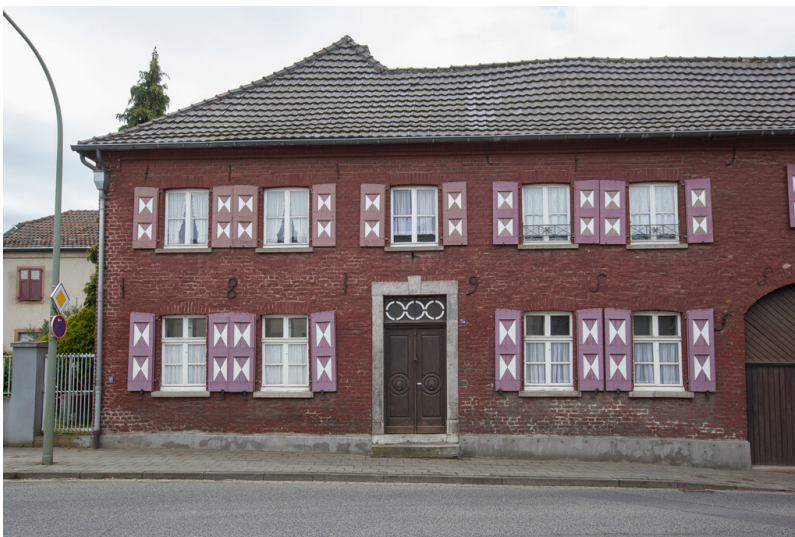
Vierseitige Hofanlage mit Wohnhaus und Tordurchfahrt - Keyenberger Markt 11 und 11a in Erkelenz-Keyenberg (2019)