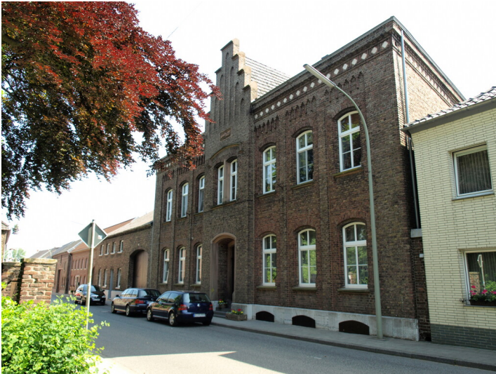
Ringelkamphof, Holzweilerstraße 37-39 in Keyenberg (2010)