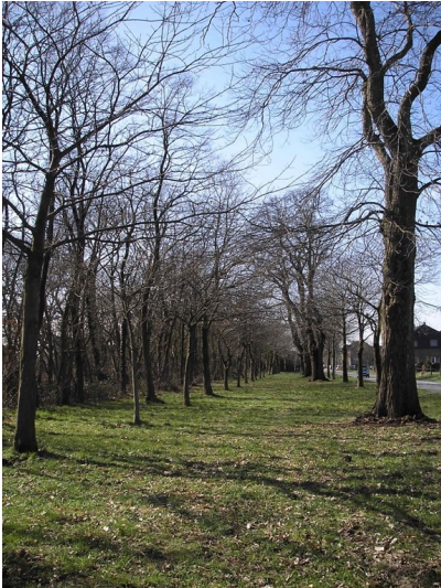
Blick auf die Edelkastanien-Allee in der Winnenthaler Straße in Alpen-Bönninghardt (um 2010)