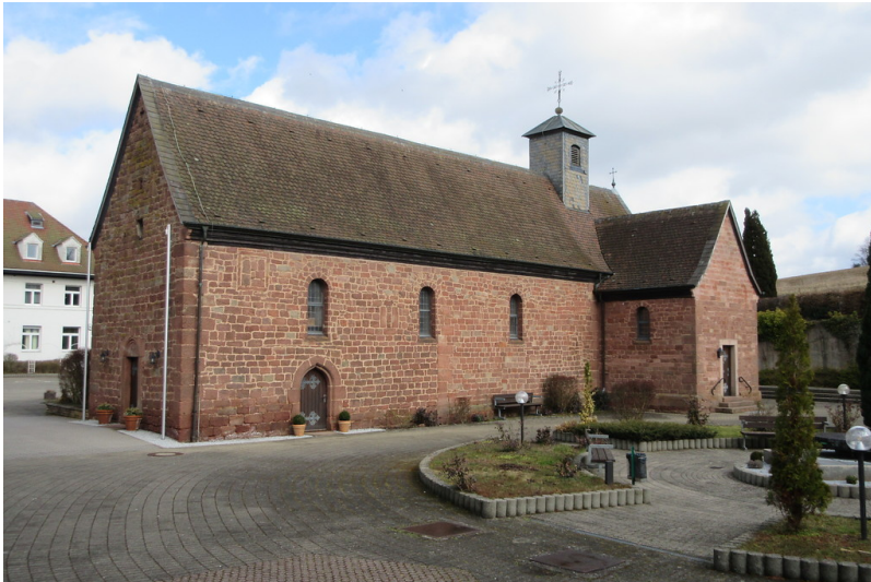
Wallfahrtsort Maria Rosenberg (2018)