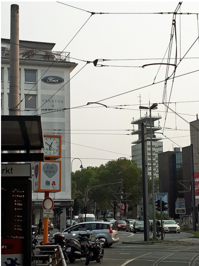
Blick vom Kölner Neumarkt über die Cäcilienstraße in Richtung des Telekom-Hochhauses in der Sternengasse (2017).