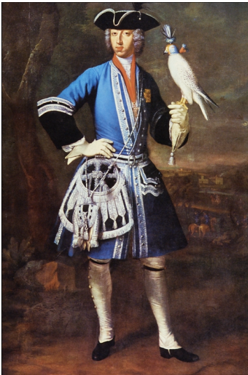
Gemälde von Peter Jakob Horemans (um 1732): Der Kölner Kurfürst Clemens August von Bayern als Falkner.