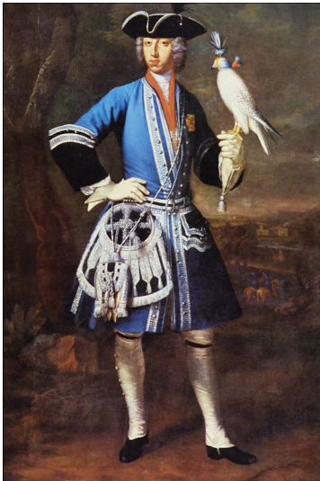
Gemälde von Peter Jakob Horemans (um 1732): Der Kölner Kurfürst Clemens August von Bayern als Falkner.