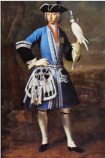
Gemälde von Peter Jakob Horemans (um 1732): Der Kölner Kurfürst Clemens August von Bayern als Falkner.