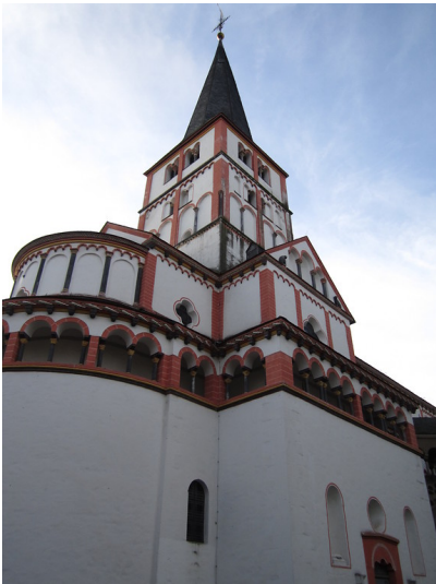
Ansicht der Doppelkirche in Bonn-Schwarzrheindorf von Südosten (2012).