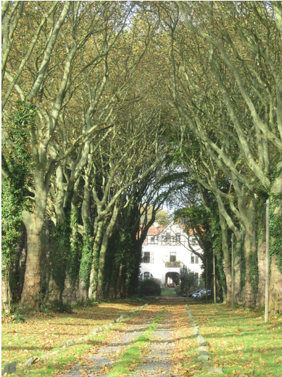
Villa Holzem (2014)