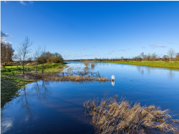
Hafen in Hollingstedt (2019)