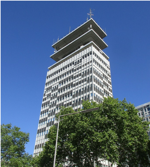
Das Telekom-Hochhaus in der Sternengasse in Köln-Altstadt-Süd (2019)