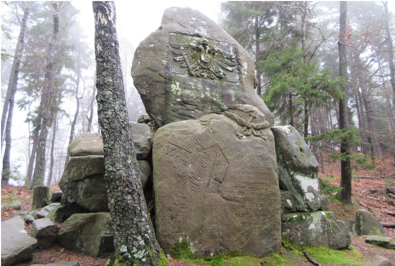
Das Österreich-Denkmal am Steigerkopf auf der Gemarkung der Gemeinde Edesheim (2018)