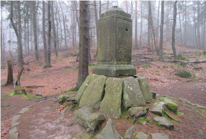
Das Pfau-Denkmal am Steigerkopf (2018)