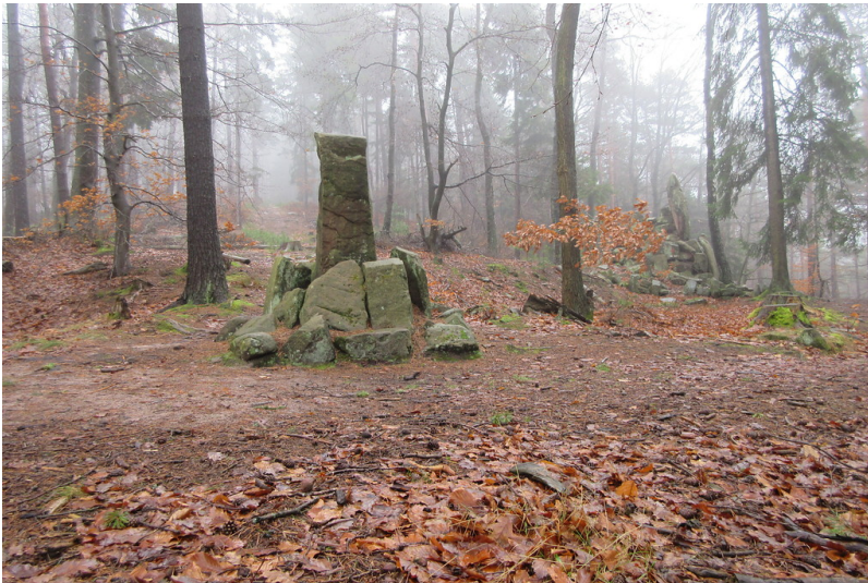
Der Schwedenstein auf dem Steigerkopf (2018)