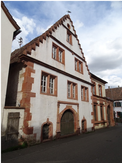
Renaissancebau Lotter-Haus im Kirchengarten (2018)