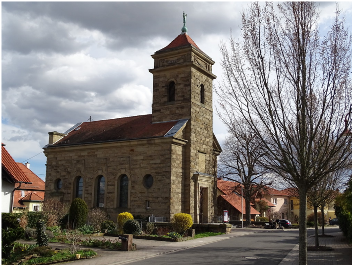
Johanneskirche in Maikammer (2018)