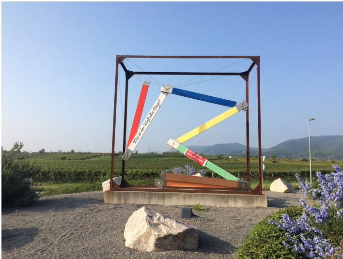
Plastik Klappmeter in Maikammer (2017)