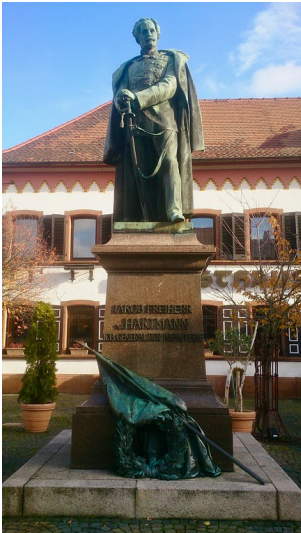
General-Hartmann-Denkmal auf dem Marktplatz in Maikammer (2017)