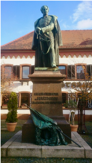
General-Hartmann-Denkmal auf dem Marktplatz in Maikammer (2017)