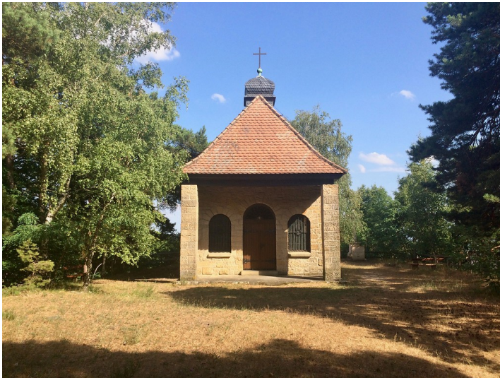
Maria-Schutz-Kapelle auf dem Wetterkreuzberg in Maikammer (2017)