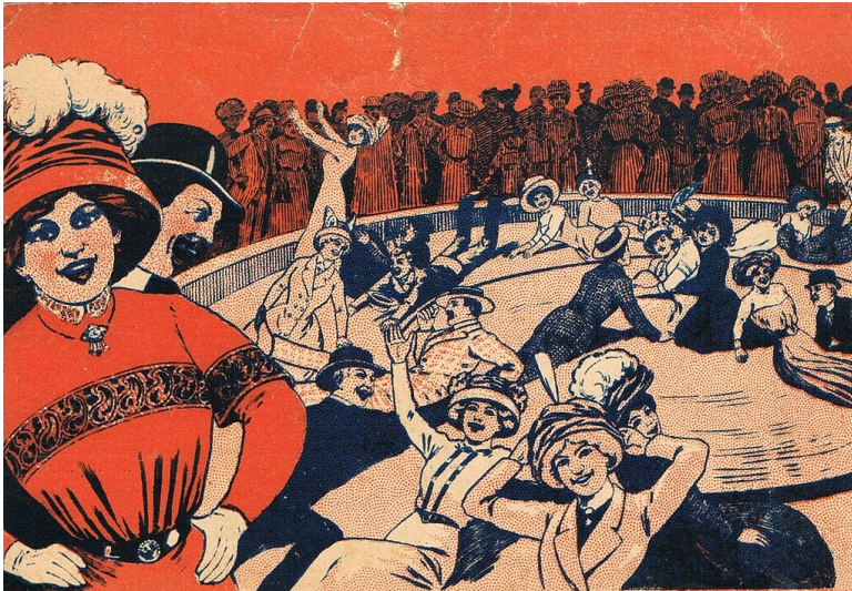
Historische Darstellung der auch "Teufelsrad" genannten Kirmesattraktion "Freudenrad" in dem zwischen 1909 und 1928 bestehenden Amerikanischen Vergnügungspark bzw. Luna-Park im Köln-Riehler Vergnügungsviertel "Goldene Ecke".