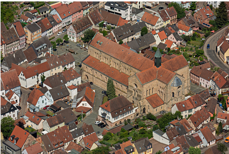
Abteikirche in Otterberg