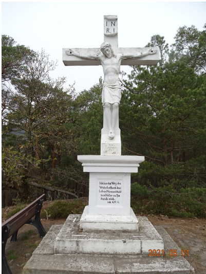
Wetterkreuz Diedesfeld (2021)