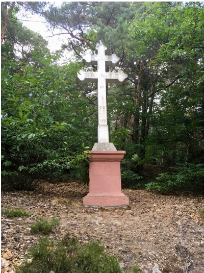
Wetterkreuz auf dem Heidelberg Süd (2017)