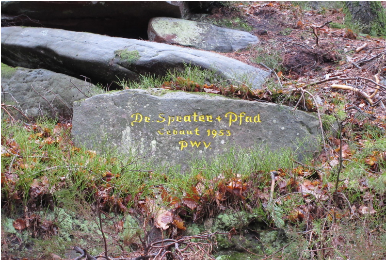
Ritterstein Nr. 185 "Dr. Sprater + Pfad Erbaut 1953" am Kesselberg (2018)