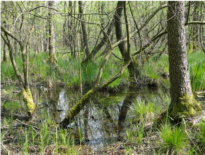
Uedemer Bruch (2013)