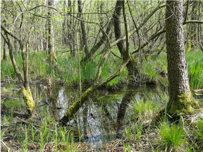
Uedemer Bruch (2013)