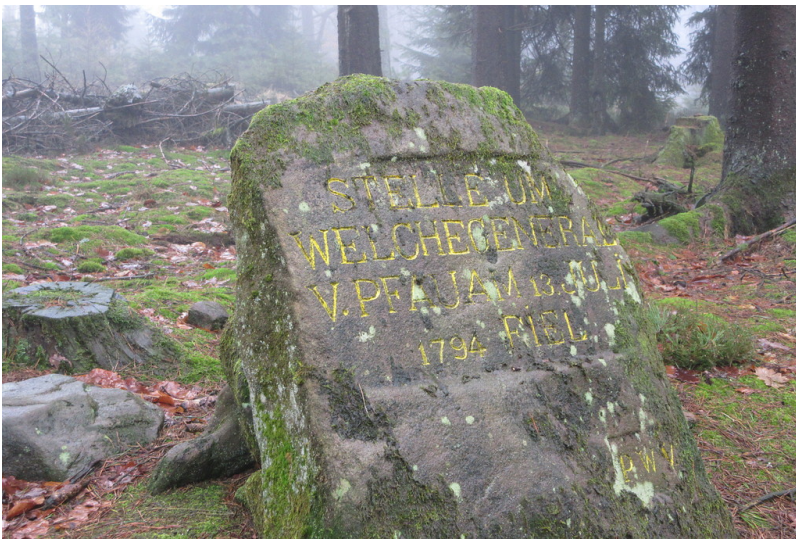
Ritterstein Nr. 68 Stelle um welche General v. Pfau am 13. Juli 1794 fiel (2018)