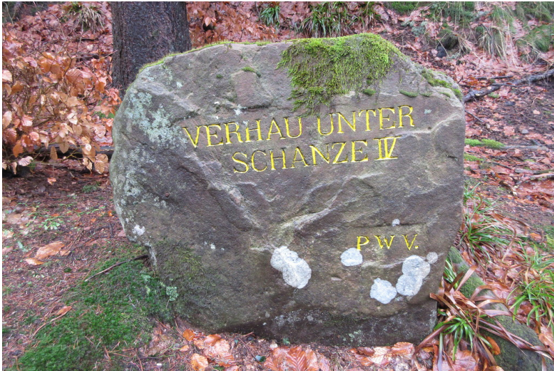
Ritterstein Nr. 67 Verhau unter Schanze IV" am Steigerkopf (2018)