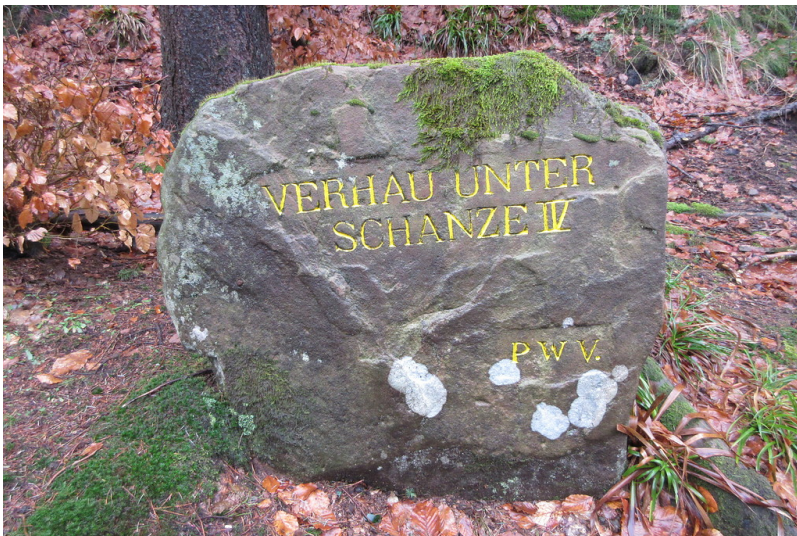
Ritterstein Nr. 67 Verhau unter Schanze IV o am Steigerkopf (2018)