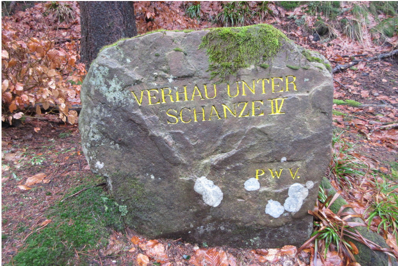
Ritterstein Nr. 67 Verhau unter Schanze IV ® am Steigerkopf (2018)