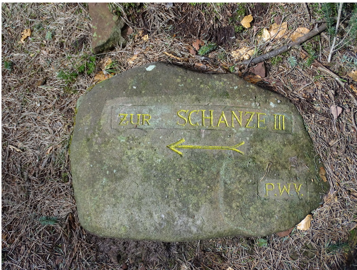
Ritterstein Nr. 64a Zur Schanze III am Steigerkopf (2018)