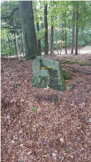
Ritterstein Nr. 63 Schanze II am Steigerkopf (2017)