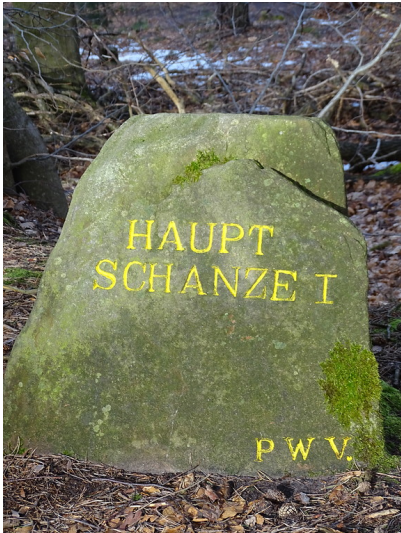
Ritterstein Nr. 62 Hauptschanze I am Steigerkopf (2018)