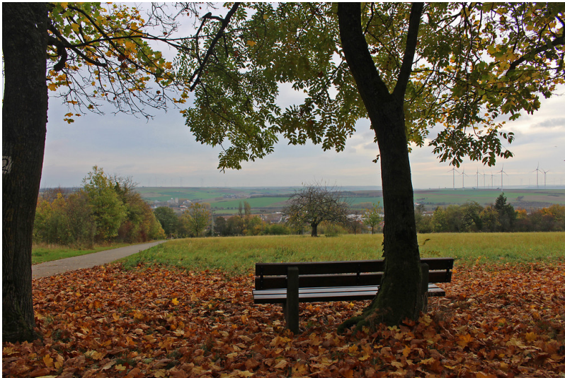
Parkanlage Schillerhain, Blick vom Standort des Wartturms in die Ferne und in Richtung Kirchheimbolanden im Herbst (2017)