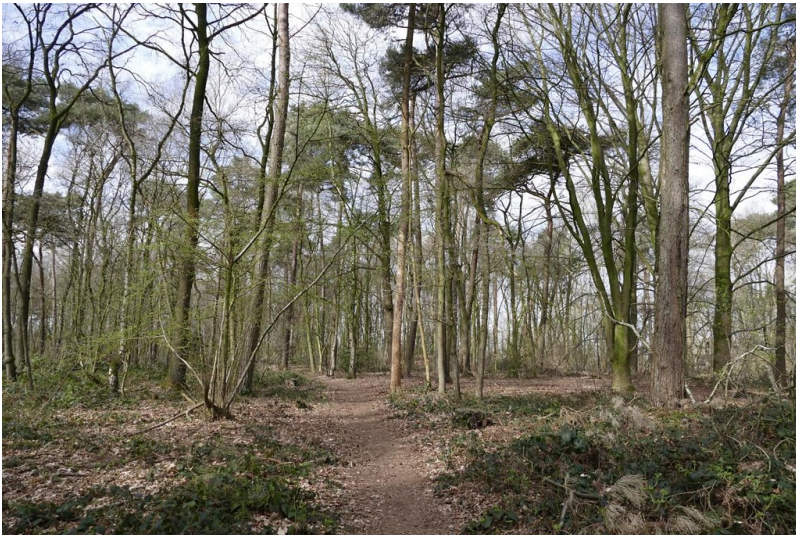
Wälder am Niederrhein (2017)